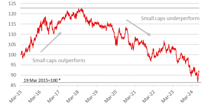
Relative price MSCI Small vs Large since March 2015

(Note) Relative price was calculated as 'MSCI Japan Small/MSCI Japan Large x 100'